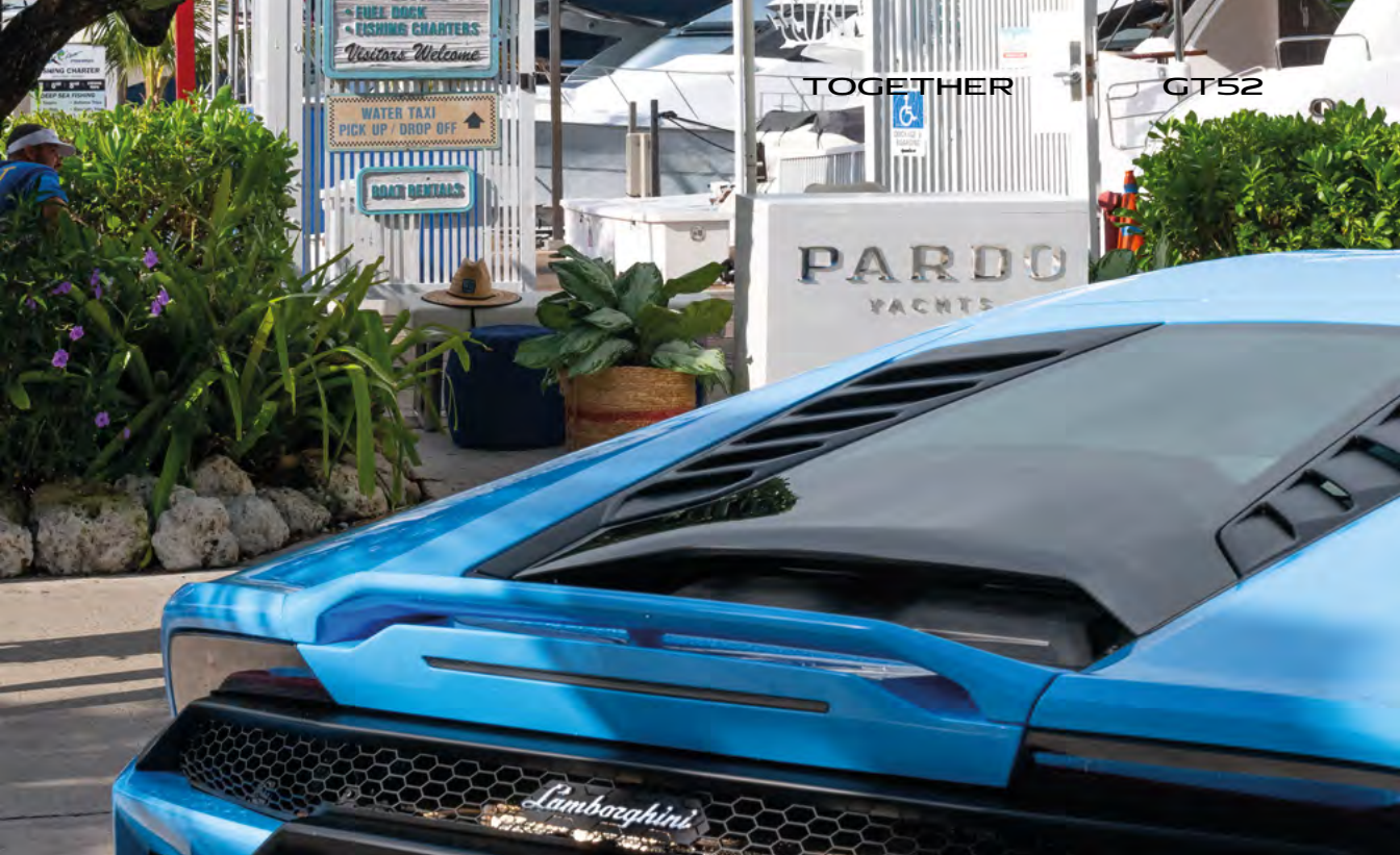
MIAMI - PARDO YACHTS & LAMBORGHINI