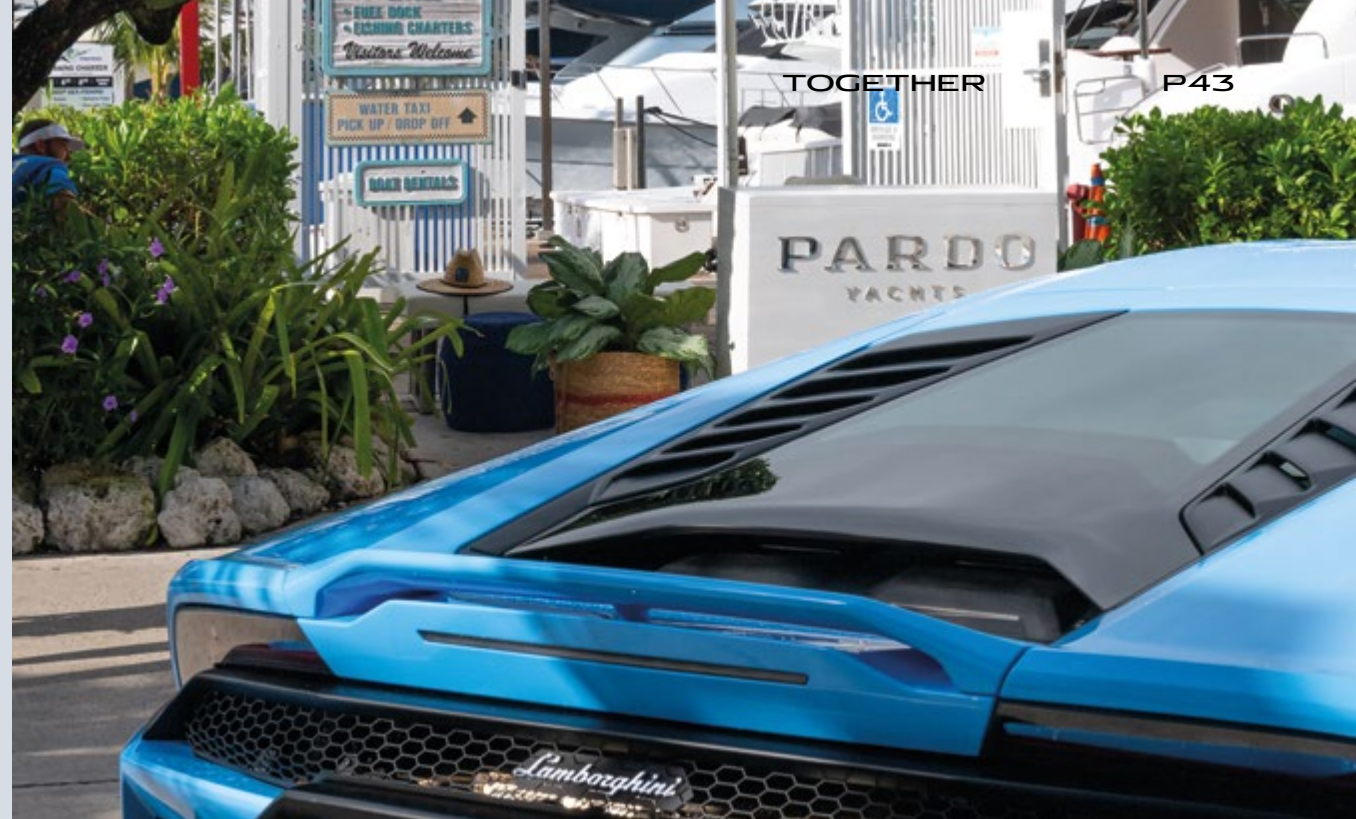
MIAMI - PARDO YACHTS & LAMBORGHINI