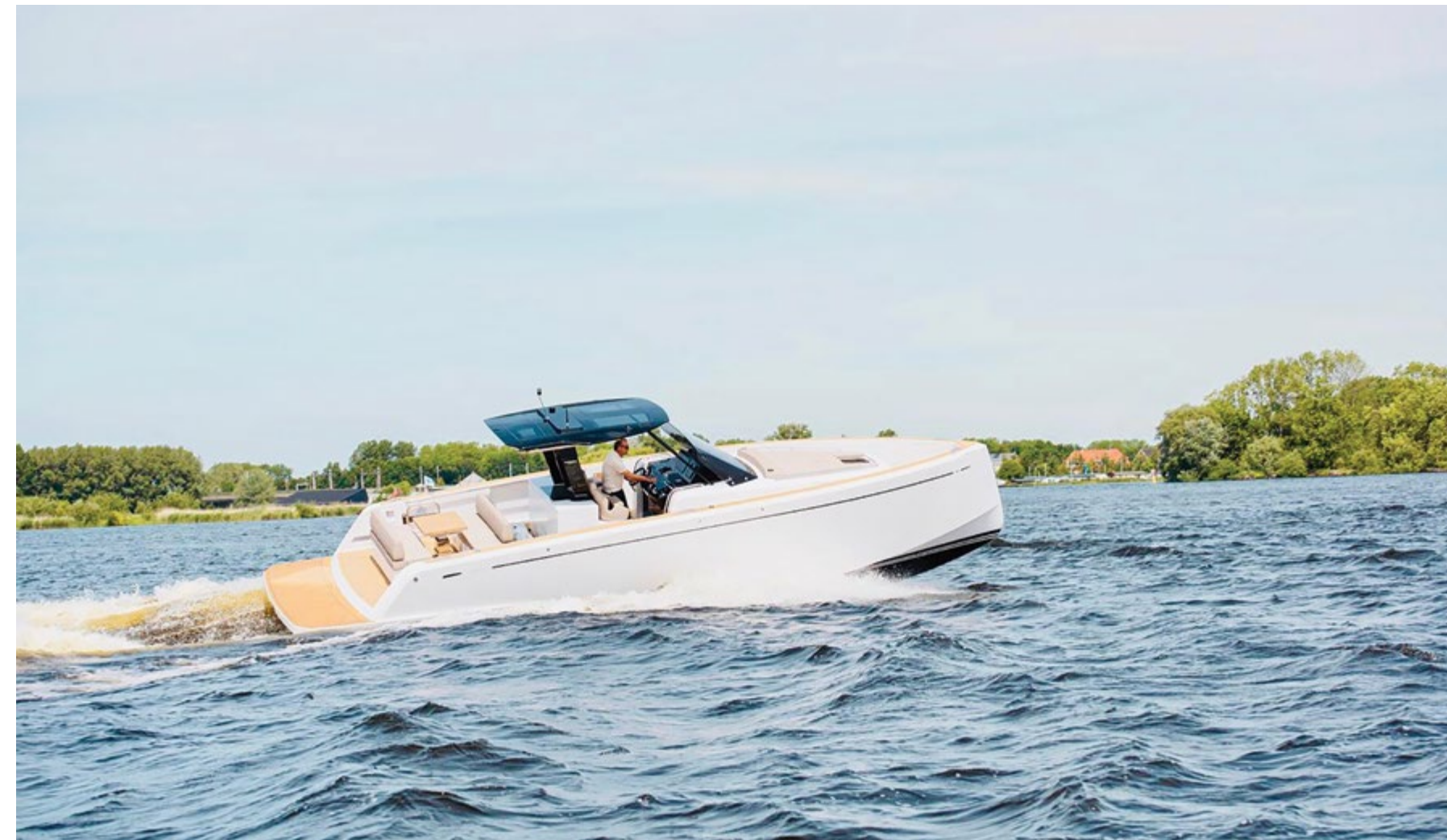
Option: electric bimini inside the T-Top Optional: bimini elettrico nel T-Top